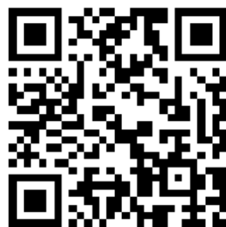
報名表單 QR CODE